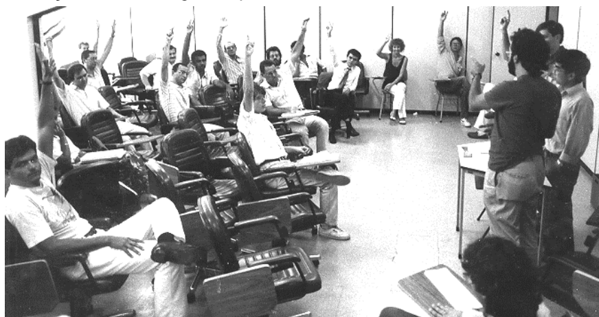
ASSEMBLÉIA DEVE REVIVER MOMENTOS DE DECISÃO.

A presença de todos os associados é indispensável, pois estaremos reavaliando os destinos da Associação, a nossa forma de atuação e a integração dos Gestores Governamentais no atual processo de reformas.