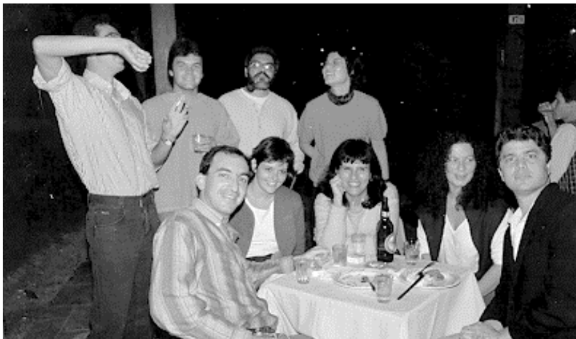
CONFRATERNIZAÇÃO NA ASBAC UNIU GESTOBABIES E GESTOSSAUROS...

Procuram-se um crime e criminosos nessa história malcontada e pior explicada da Telebrás, Bolsa de Valores, informação privilegiada, notícias manipuladas, coincidências estranhas e fortunas instantâneas, mas antes de ser um caso ela é uma representação exemplar, um auto da promiscuidade que nos governa. O governo e a parte mais esperta do nosso patriciado, que é a do capital financeiro, convivem há anos nessa zona crepuscular onde as fronteiras éticas nem sempre são visíveis e ajuda se você for, pelo menos, semibandido. Se há crime nesse caso específico nem importa, o